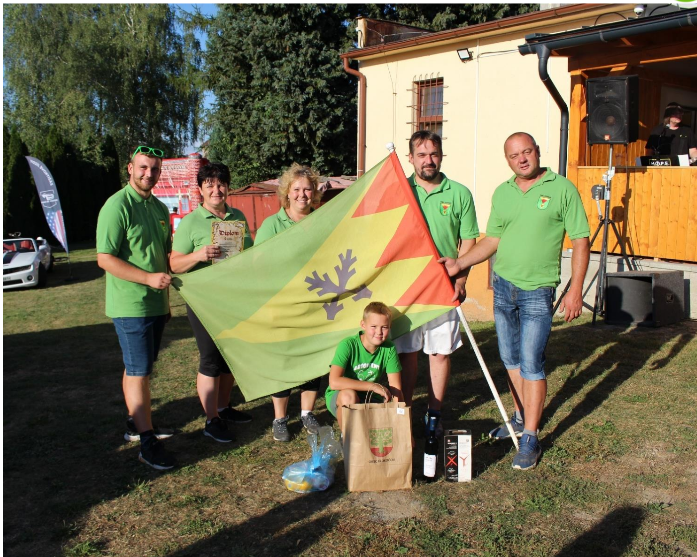
Zástupci naší obce na Podoubravském víceboji.